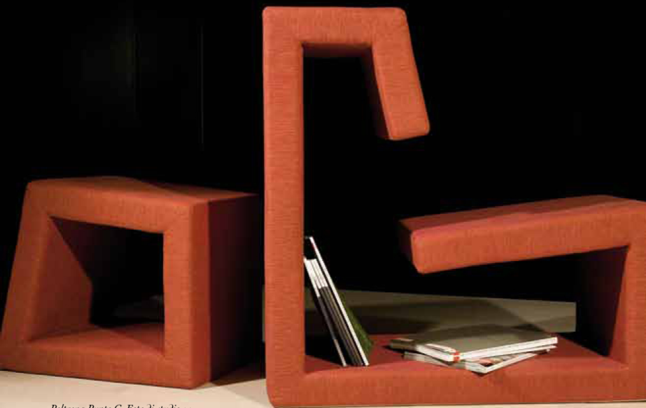
Poltrona Punto G. Foto di studio ++

info@soquadro-ad.com www.soquadro-ad.com